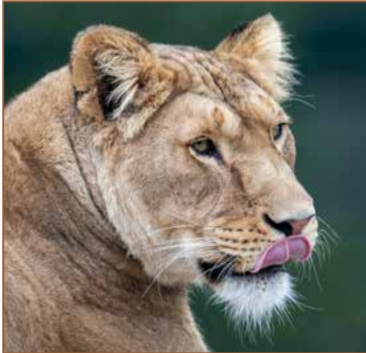
1. Carnivoren - vleeseters

Er zijn drie soorten eters in de voedselketen. Een voedselketen is de manier waarop we de natuur ordenen: wie eet wie? Degenen die jagen noemen wij roofdieren. Degenen die worden gegeten noemen we de prooi.