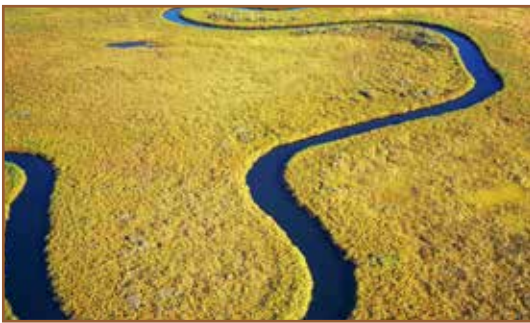
Rivieren, meren en kustlijnen