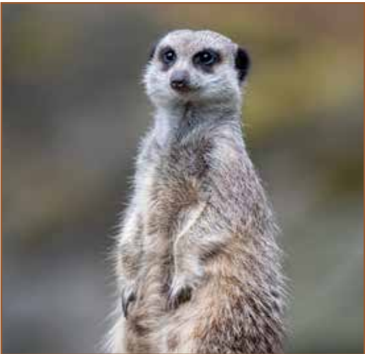
3. Omnivoren – alleseters