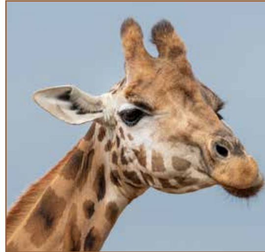
2. Herbivoren- planteneters